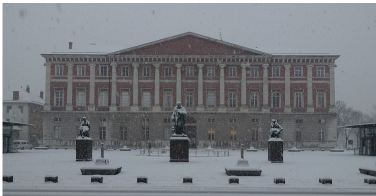
Chambéry sous la neige le 3 mars, et ce n'est peut-être pas fini